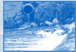
ACEITES, JABONES Y DETERGENTES

Existen muchos problemas sociales y políticos que afectan la calidad de agua, por ejemplo: