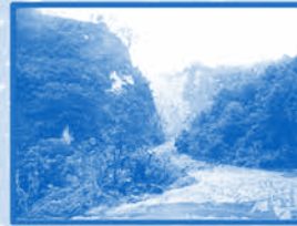
EROSIÓN DE SUELOS